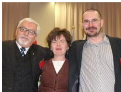
A konferencia szervezőbizottságának vezetői a záróünnepség után