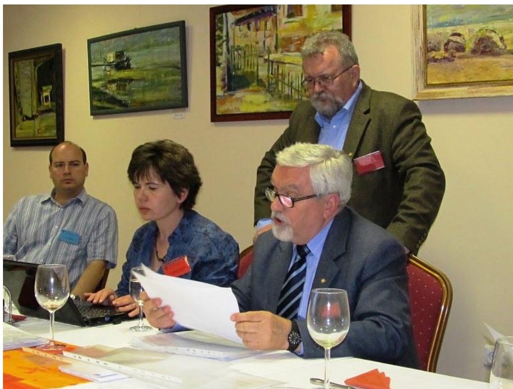
A jegyzőkönyvek ellenőrzése a fő zsűri ülésén

Ugyancsak megkönnyítené a munkát, ha a fő zsűri ülésén, miután a helyezéseket megállapították, a zsűri elnökök ott, a helyszínen aláírnák a helyezést igazoló okleveleket.